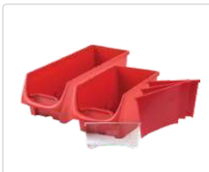
Modul-Box*, leveys 162 mm, Osa nro: 10480-03 Modul-Box**, leveys 162 mm, Osa nro: 10481-03 Jakaja, leveys 162 mm, Osa nro: 10482-03 Ikkuna, leveys 162 mm, Osa nro: 10483-03 *Syvyys 324 mm, **Syvyys 486 mm.