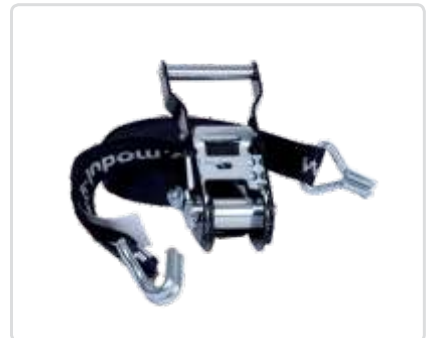
Sidontaliina räikällä ja J-koukuilla 4,5 m Osa nro: 11716