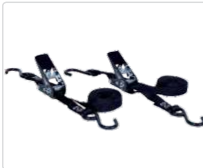
Sidontaliina kiristimellä, S-koukuilla ja kapealla hihnalla, 2,0 m (2 kpl) Osa nro: 11722