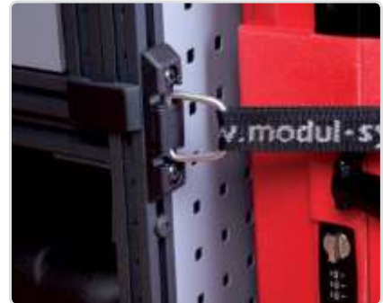
Kiinnityssilmukka T-uraan Osa nro: 50025-03