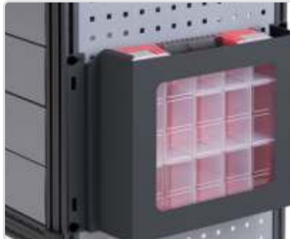
Säilytyslokero Mobil-Boxeille Osa nro: 50230-03