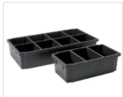
Sisälaatikko Varten 108 mm korkea laatikot, Osa nro: 10530-03* Varten 108 mm korkea laatikot, Osa nro: 10533-03** Varten 162/216 mm korkea laatikot, Osa nro: 10535-03*** 162 mm leveys, 324 mm syvyys, 324 mm leveys, 486 mm syvyys, 324 mm leveys, 324 mm . syvyys