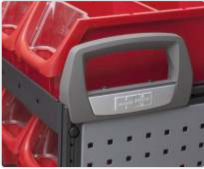
Vetokahva Osa nro: 50014-03