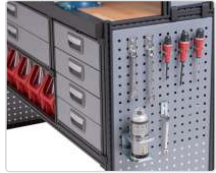
Työkalunpidinsarja Osa nro: 10848 (15 kpl) Osa nro: 10849 (30 kpl) Osa nro: 10850 (50 kpl)