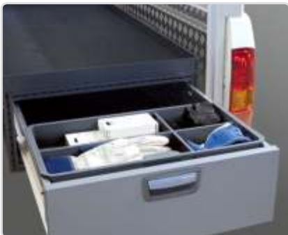
Modul-Insert Osa nro: 12127-03