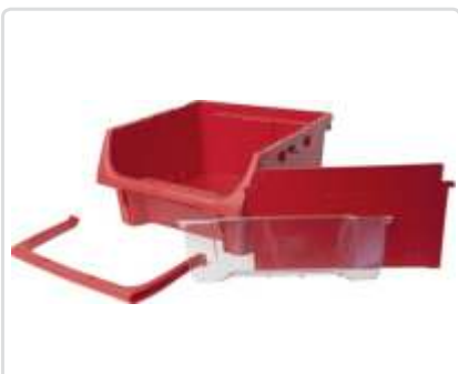
Modul-Box*, leveys 324 mm, Osa nro: 10487-03 Jakaja, leveys 324 mm, Osa nro: 10488-03 Ikkuna, leveys 324 mm, Osa nro: 10489-03 Kahva, leveys 324 mm, Osa nro: 10490-03 *Syvyys 324 mm