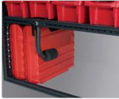
Työkalulaatikon kiinnike Osa nro: 50250-03